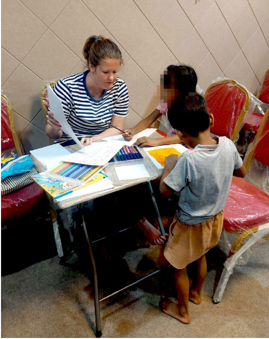
Lapset osallistuvat innokkaasti värivalintoihin.