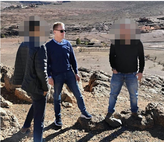
Suunnittelukokous seuraavaa lähetysmatkaa varten Mauretaniaan.

Kaikki kontaktit eivät luonnollisesti johda pidemmälle. Mutta jos kuulijat osoittavat kiinnostusta, yhteistyökumppanimme noudattaa selkeää strategiaa varmistakseen kaikkien osapuolten turvallisuuden. Ensin pyritään